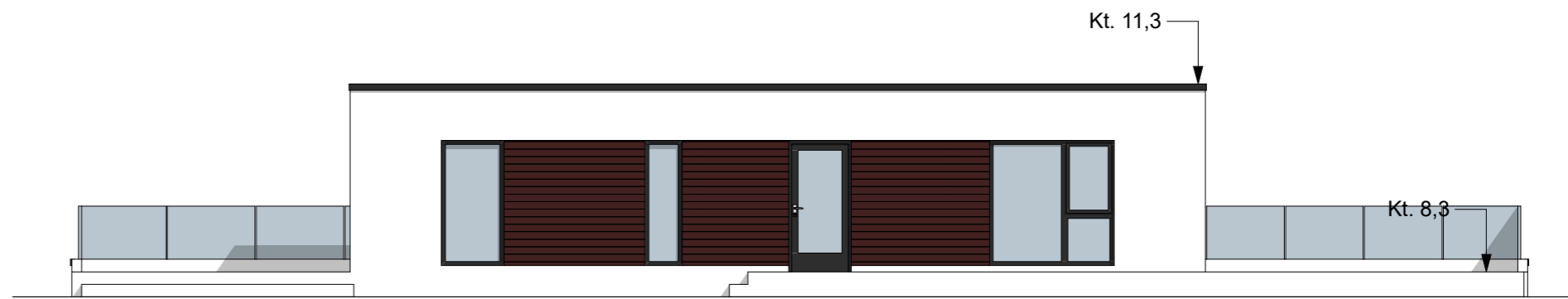
FASADE MOT NORD-ØST