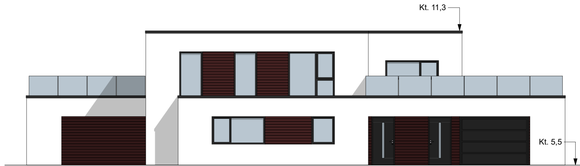
FASADE MOT SØR-VEST